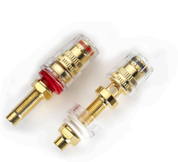
[ WT-FB-1960-G ]