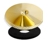
[ WT-C-30-5-G ]