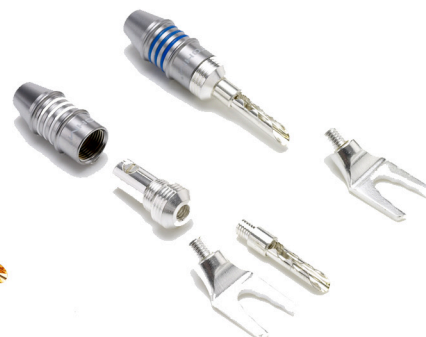
[ WT-STU-SET ]