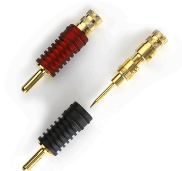
[ WT-LMB ]