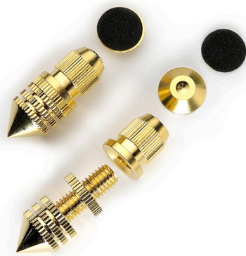
[ WT-15MB-32-G ]