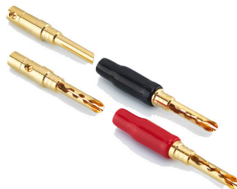
[ WT-MB-1053-G ]