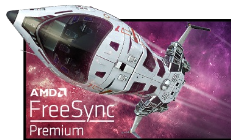
Technologie FreeSync™ Premium

La dalle en technologie Fast IPS à 240 Hz garantit des scènes de champ de bataille vives, haute fidélité d'affichage avec des couleurs exceptionnellement précises et offre un temps de réponse d'image animée (MPRT) époustoufflant de 1 ms.