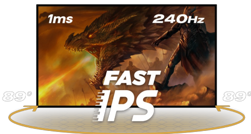
240Hz & 1ms MPRT

La dalle en technologie Fast IPS garantit une superbe qualité d'image, et la possibilité de régler la luminosité et les nuances sombres avec la fonction Black Tuner offre de meilleures performances de visualisation dans les zones ombragées. Pour assurer le confort pendant les sessions de jeu marathon, vous pouvez facilement ajuster la position de l'écran selon vos préférences grâce au support réglable en hauteur.