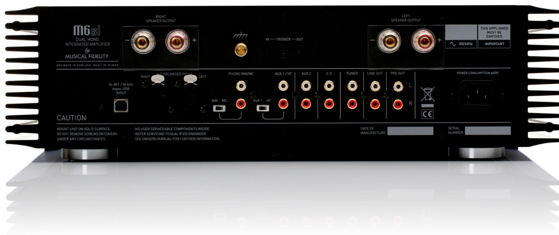
M6si INTEGRATED AMPLIFIER