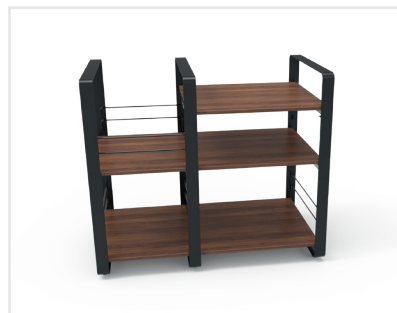
1 module principal / 1 module complémentaire Finition noyer

● Noir/Noir SKU : NORLOFCENBK EAN : 3700795180303