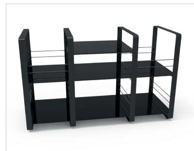
1 module principal / 2 modules complémentaires Finition noire