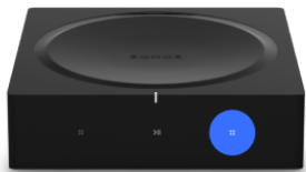
Contrôle du volume