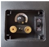
sélecteur de puissance