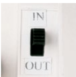
commutateur intérieur / extérieur